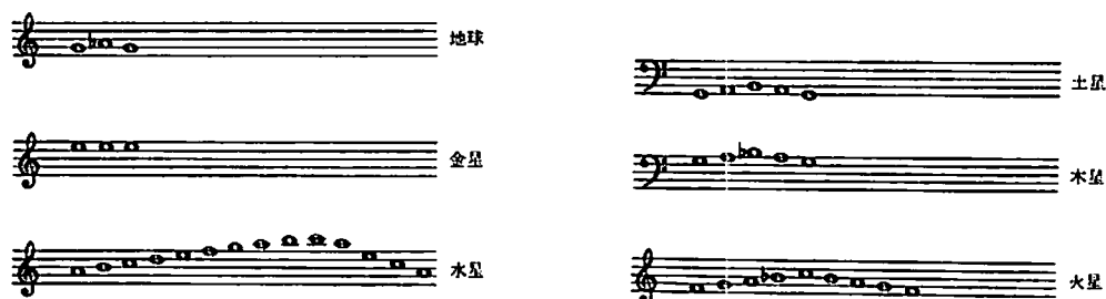
ケプラーが計算した各惑星の音組織

「諸事物の創造に先だつて久遠に神の精神に属していた幾何学は、神自身であり—というのも、神自身でないものが神の中にあるだろうか—、また天地創造のための原型を与えたものである。幾何学は神の姿とともに人間の内に移り込んだものであって、眼を通して初めて内に取り入れられたものではない」。